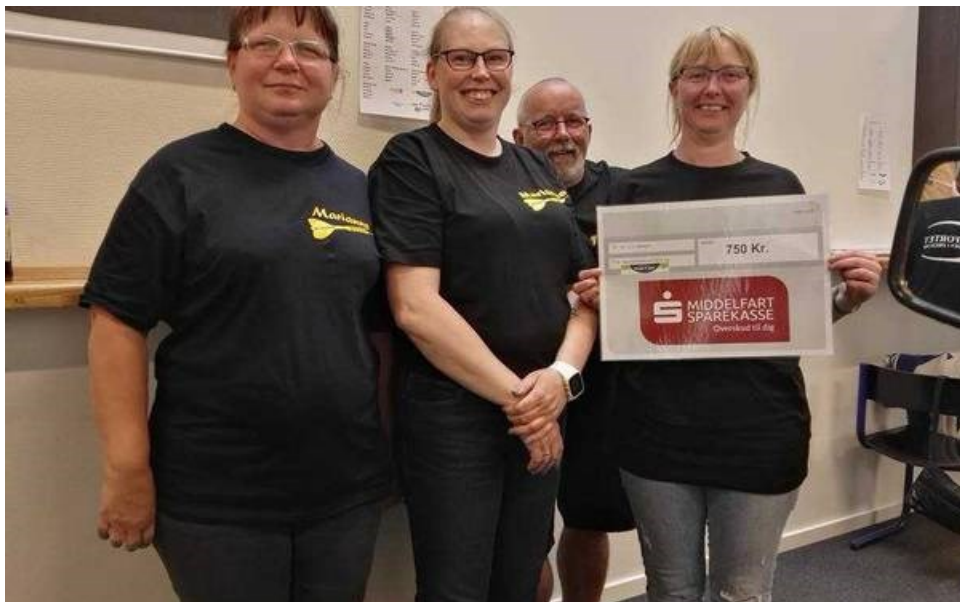
Det blev til en andenplads til KGGO ved High Five Meyra Darts 2018. Pressebillede